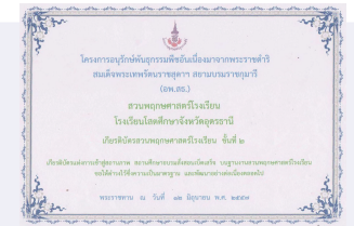
เกียรติบัตรฯ ชั้นที่ 2