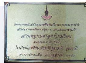
ป้ายสนองพระราชดำริฯ

Website http://rspg.or.th/botanical_school/index.htm