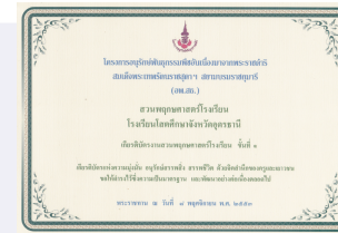
เกียรติบัตรฯ ชั้นที่ 1